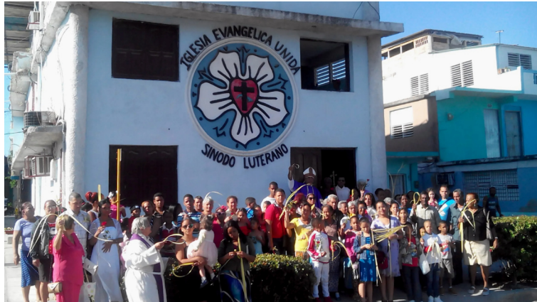
Lutherische Synode in Santiago de Cuba, März 2026

Heute zählt die Vereinigte Evangelische Kirche – Lutherische Synode (IEU-SL), zu der auch die Lutheraner in Cocodrilo gehören, etwa 1.500 Mitglieder, die auf elf Gemeinden in sieben Provinzen verteilt sind. Von ihren Anfängen im Zusammenhang mit der amerikanischen Missouri-Synode bis zu ihrem Eintritt in den Lutherischen Weltbund im Jahr 2018 haben die kubanischen Lutheraner ein Modell einer zugleich traditionsorientierten, aber auch der Moderne zugewandten Kirche entwickelt, die tief in die soziale Begleitung der Bedürftigen involviert ist. Diese Arbeit stieß jedoch oft auf den Widerstand durch die jede Initiative erstickende Kommando-wirtschaft und eines feindseligen staatlichen Umfelds, in dem Religionsfreiheit, obwohl sie auf dem Papier garantiert ist, nicht in reales Handeln umgesetzt wird. Hilfe im Sinne tätiger Nächstenliebe wird von Repräsentanten des Staates oft mit Argwohn betrachtet und als unerwünschte Konkurrenz abgewürgt.